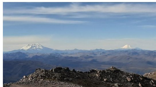
Blick vom Cayambe aus auf Antisana und Cotopaxi